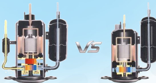
Gree kahestmeline inverter kompressor